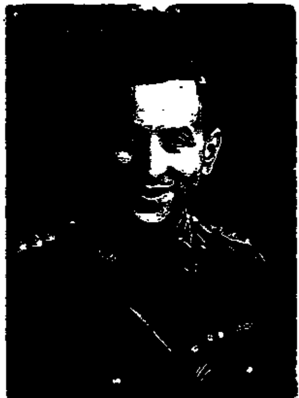
ד"ר ס.תן בטבח 1945 במדי צבא בריטי ח-11/1740