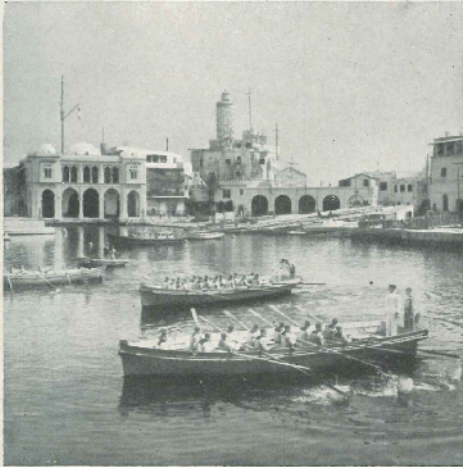
L'Amirauté et son sémaphore.

laisser abuser par certaines radios étrangères. Le gouvernement vous tiendra au courant de tous les événements qui se produiront. La réponse du Maréchal au président Roosevelt fixe à chacun son devoir. La discipline, le calme et l'union sont nécessaires. L'amiral Darlan est sur place. La France a connu d'autres épreuves. Elle fera face à celle qui nous est infligée par un pays pour lequel le sang français fut jadis versé. L'honneur l'exige.