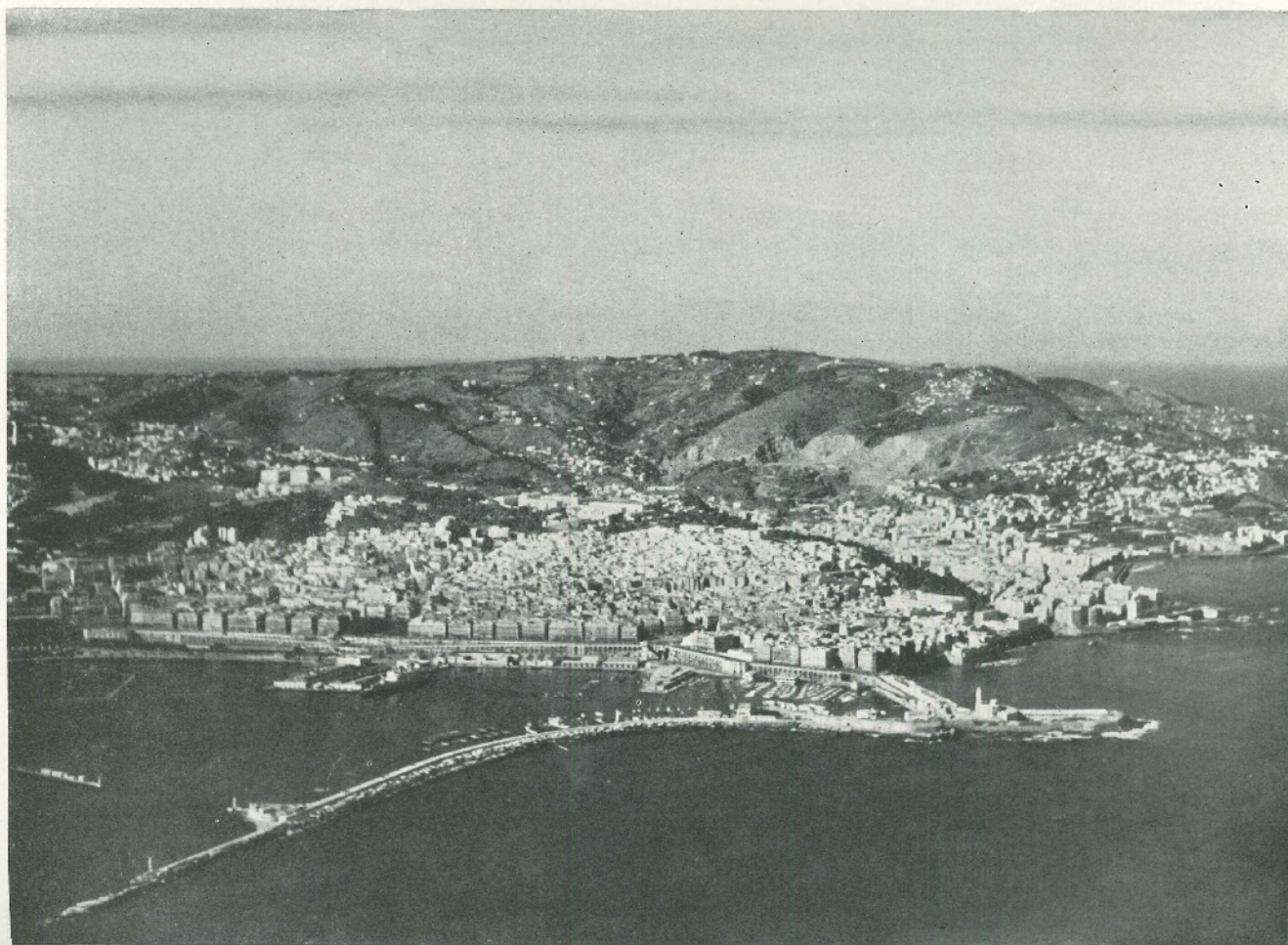
Le fort, le quartier de l'Agha Mustapha et l'Amirauté d'Alger.

Nous demandons aux Français de ne pas se